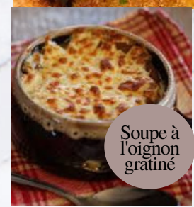
Soupe à l'oignon gratinée