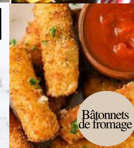
Bâtonnets de fromage

Poulet PopCorn, 6 Ailes de Poulets, Frites, Rondelle D'Oignon